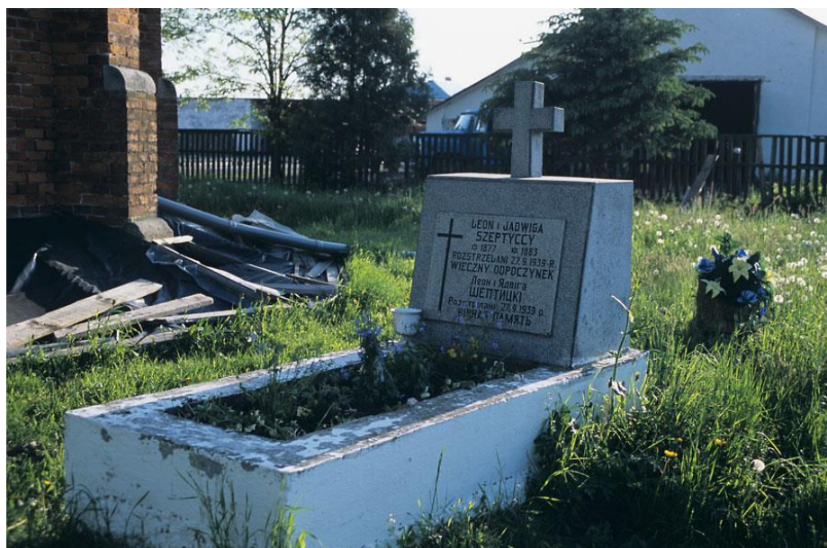
Grób Jadwigi i Leona Szeptyckich w Przyłbicach. Na nagrobku napisy widnieją w dwóch językach. Wypisano również przyczynę śmierci jaką było rozstrzelanie.